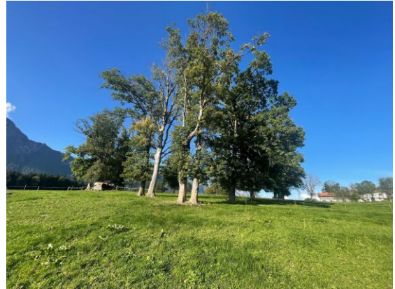
BREITENBACH am Inn - KLEINSÖLL - Baugrundstück 600 m 2