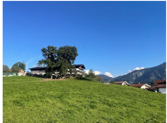
BREITENBACH am Inn - KLEINSÖLL - Baugrundstück 600 m 2