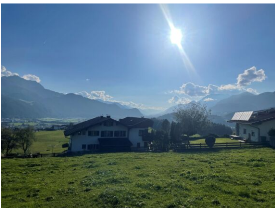
BREITENBACH am Inn - KLEINSÖLL - Baugrundstück 600 m 2