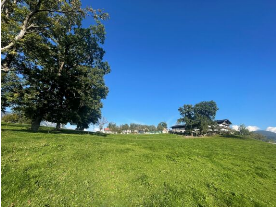
BREITENBACH am Inn - KLEINSÖLL - Baugrundstück 600 m 2