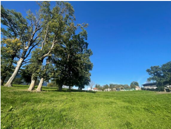
BREITENBACH am Inn - KLEINSÖLL - Baugrundstück 600 m 2